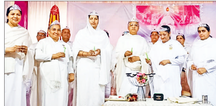
बहादुरगढ़। कार्यक्रम में मंच पर मौजूद अतिथि व आयोजक।