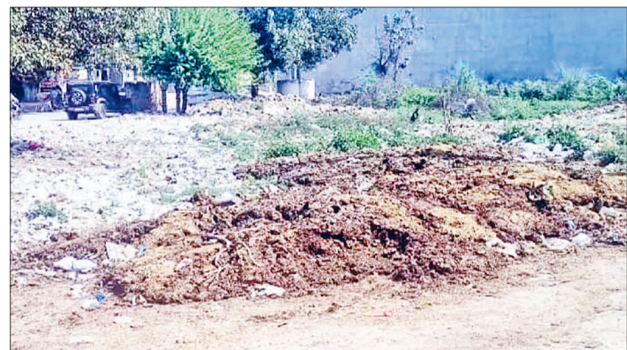
बहादुरगढ़। पार्क के पास डाला गया गोबर।