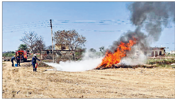
झज्जर। मॉक ड्रिल के दौरान घायल कर्मी को एंबुलेंस के माध्यम से अस्पताल ले जाते हुए बचाव दल के सदस्य और मॉक ड्रिल के दौरान आग पर काबू पाने का प्रयास करते हुए फायर ब्रिगेड कर्मचारी।