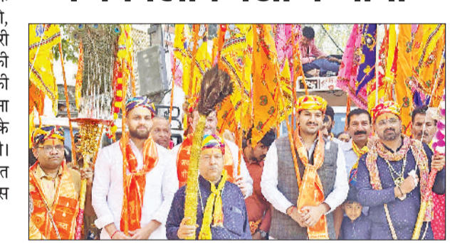
बहादुरगढ़। ध्वजा यात्रा में शामिल श्रद्धालु।

परशुराम मंदिर से शुरू होकर नजफगढ़ रोड के श्री बाला जी मंदिर तक गूले जयकारे