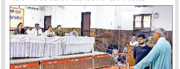
झज्जर। बैठक में जन शिकायतों की सुनवाई करते हुए डीसी।