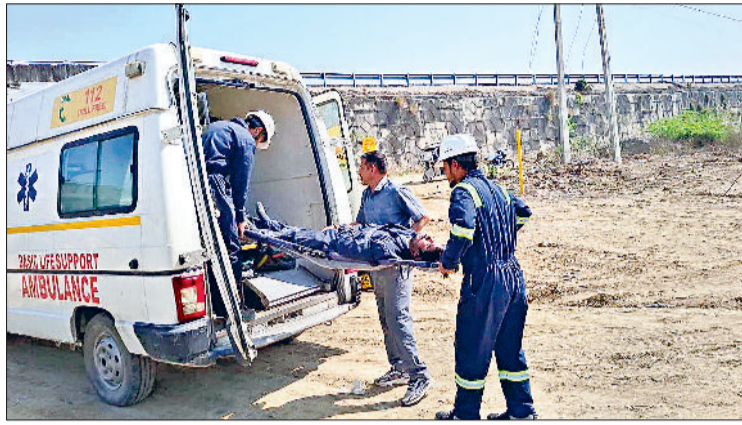
झज्जर। मॉक ड्रिल के दौरान घायल कर्मी को एंबुलेंस के माध्यम से अस्पताल ले जाते हुए बचाव दल के सदस्य और मॉक ड्रिल के दौरान आग पर काबू पाने का प्रयास करते हुए फायर ब्रिगेड कर्मचारी।

फायर ब्रिगेड, स्वास्थ्य विभाग और पुलिस प्रशासन के सहयोग से हुई मॉक ड्रिल हरिभूमि न्यूज | झज्जर