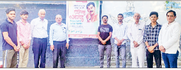
बहादुरगढ़। शहीद स्मारक पर मौजूद कमेटी के सदस्य।