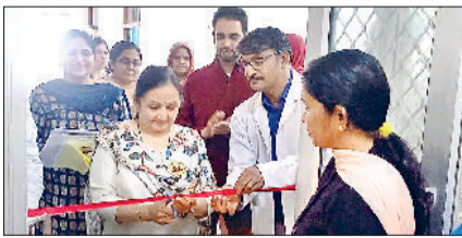
झज्जर। ऑपरेशन थिएटर का उद्घाटन करती सीएमओ।