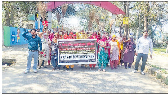
झज्जर। प्रदर्शन करते हुए नगर पालिका संघ के कर्मचारी।