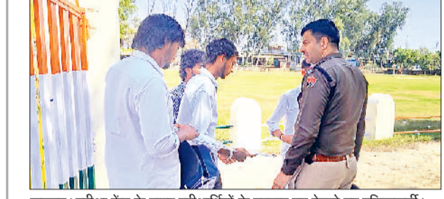
झज्जर। परीक्षा केंद्र के बाहर परीक्षार्थियों के पहचान पत्र देखते हुए पुलिसकर्मी।