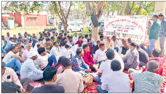
झज्जर। बिजली निगम कार्यालय में धरना - प्रदर्शन करते हुए कर्मचारी।