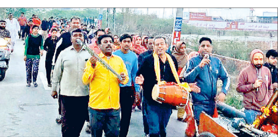
झज्जर। प्रभातफेरी के दौरान भजन सुनाते हुए श्रद्धालु।