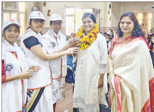
बहादुरगढ़। मुख्य अतिथि का स्वागत करती स्वयंसेविका।

प्रशिक्षित युवा समाज की सबसे बड़ी शक्ति: मोहिनी हरिभूमि न्यूज | बहादुरगढ़